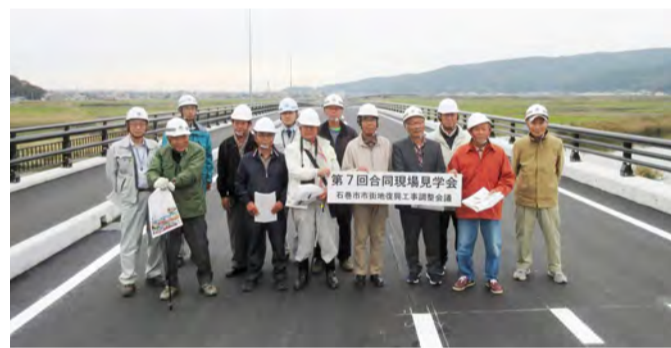
国道398号石巻バイパスで記念撮影

11月5日、復興事業の進捗状況などを紹介する「合同現場見学会」を開催。稲井地区からの3名