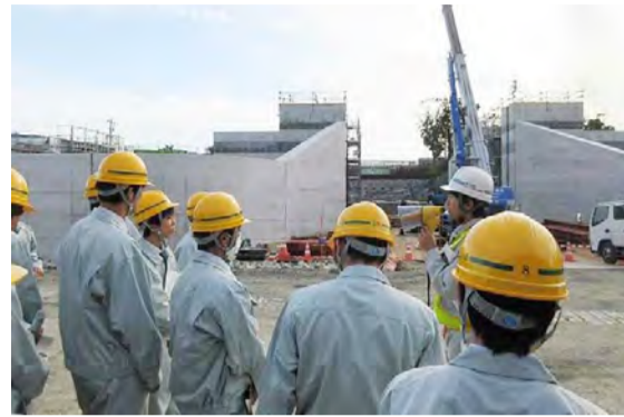
石井水門工事を見学