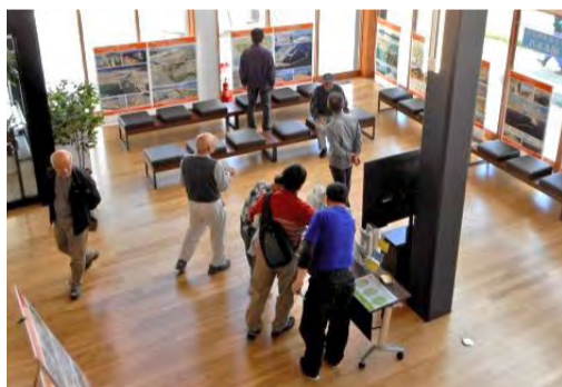
多くの方に来場いただきました。