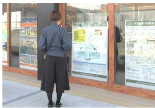
外部に面した展示の様子

復興事業や調整会議の取組を紹介するパネル展を10月15日から11月2日まで開催しました。