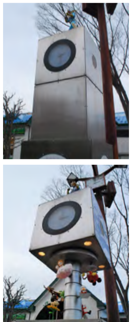
時計下のカーが下がり、カラクリが登場

石巻駅前から石ノ森萬画館を結ぶ通りは「マンガロード」と呼ばれ、観光客がキャラクターと記念撮影をする姿もみられます。始点の「石巻駅」ではキャラクターが登場するカラクリ時計が「マンガの街」をアピールしています。