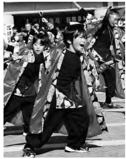
▲鳴子を持ち エネルギッシュに踊る姿をパチリ!

10月29日(土)、サン・ファン館で「サン・ファン・パウティスタ出帆記念イベント」が行われ、team HDC(蛇田小学校ヨサコイ・ソーラン)の子どもたちが、元気なヨサコイを披露しました。