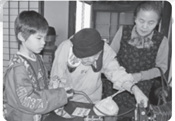
▲昔のカメラに興味津々