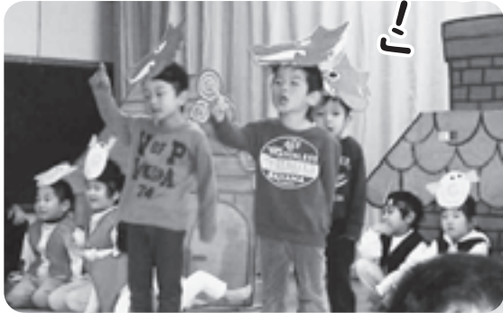
11月27日(土)、雄勝保育所で「発表会」が行われました。