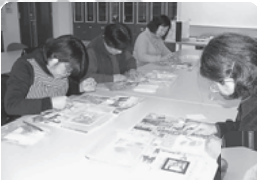
12月9日(木)、北上公民館で、「*パウダーアートの教室」が行われました。