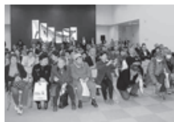
▲6階市民ギャラリー 式典の様子をモニターでみる市民の皆さん