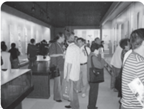
温州市博物館において、日中友好書画展が 開催され、多くの温州市民が作品を鑑賞しま した。