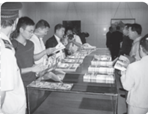
同会場において、「石巻観光 PR展」が開催されました。 観光ガイドブックや観光パネ ルを通して、石巻市の魅力を持 て余すことなく伝えてきました。 石巻市の“自然”や“食”に興 味を持たれているようでした。