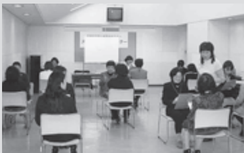
▲昨年度のセミナーの様子