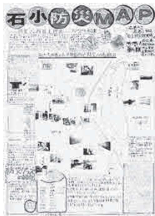
◆入賞した作品を展示していますので、どうぞ、ご覧ください。 ・5月11日(月)まで新庁舎予定建物（旧さくら野百貨店）屋外 掲示板国道398号線側 ・5月12日(火)～25日(月)石巻健康センター あいプラザ・石巻