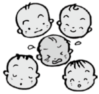
図 保険年金課（内線474）・各総合支所市民生活課

②左記①以外の方・↓8月8日（金）までに申請書を郵送しますので、必要事項を記入の上、8月29日（金）まで申請してください。