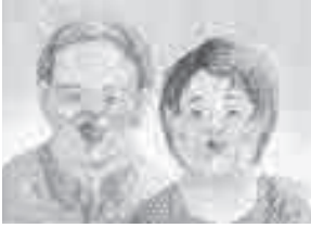
▲マンガッタンイラストギャラリー第15回秋の萬画館賞受賞作品