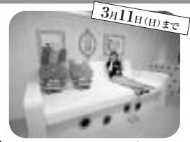
3月11日（日）まで ▲オトナサイズ