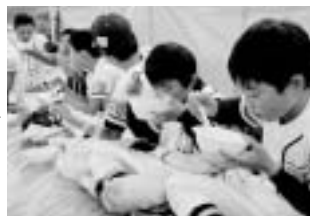
しじみ汁▶ ベッコウしじみの大きさにびっくりしながら、おかわりをしていました。