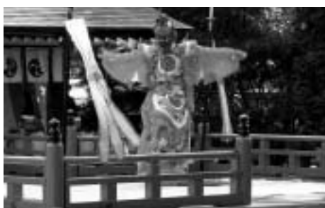
▲谷地どんがまつり「林家舞楽」 谷地八幡宮の例祭で、毎年9月中旬の4日間開催。「林家舞楽」は国の重要無形民俗文化財に指定され、八幡宮の神職を勤める林家により千百余年の長きにわたり一子相伝されてきたものです。

9月に行われた見学ツアーでは、華やかな歌踊りとお雛子による屋台巡演や、勇壮な凱旋奴の行列など、町の一大祭となっている「谷地どんがまつり」を見学しました。同まつりは、約4000年もの歴史を超えて紅花交易により伝えられた京文化を、今なお色濃くとどめる例祭です。中でも古い歴史を持つ「林家舞楽」は、日本四大舞楽にも数えられています。古代の舞と音色、凱旋奴による独特の振り歌など、その勇壮な姿に参加者は目を奪われていました。