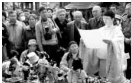
▲谷地ひなまつり「雛供養」 毎年月遅れの4月2日～3日に、河北町の中心部谷地地区で開催。紅花交易により旧家に伝えられた数々の雛人形が展示され、大通りには雛市が立ち、雛人形が販売されるほか、雛供養の神事も行われます。