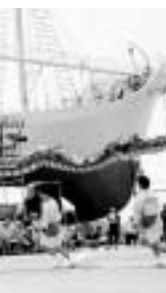
▲ 昨年の牡鹿鯨まつり