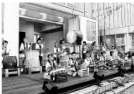
▲ 昨年のサマーフェスタ・イン・かほく