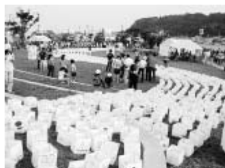
▲ 第5回 石巻マンガ灯ろう祭り