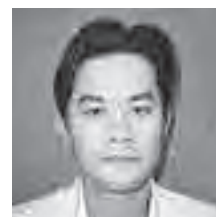
市立病院 主任臨床工学技士