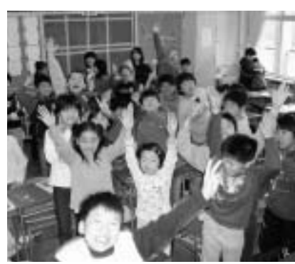
休み時間は元気いっぱい

各種の行事などに一生懸命に取り組んでいます。また、学校の授業風景を地元の方に見ていただくなど、地域との交流も積極的に行っています。