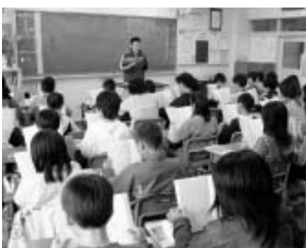
授業中はまじめです

昭和27年(1952)の創立で、当時は552人が在籍していました。昭和47年には全校で1,218人の児童が在籍しました。昭和48年に貞山小学校が開校し、半数が移籍したことが少子化の影響などで、現在の児童数は、286人となっています。