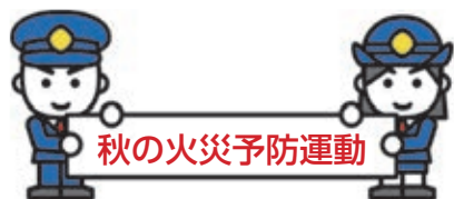
図 石巻広域消防本部予防課 ☎95-7167