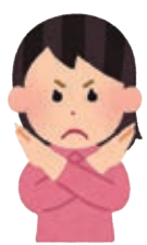
図 地域協働課 (内線4234)