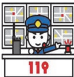
図 石巻消防署警防係 ☎95-7112

また、目の前で起きた事故などで通報する場合、気が動転し興奮した状態になりがちです。1分1秒を争う場合でも落ち着いて119番通報できるように正しい通報要領を身につけましょう。