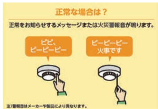
図 石巻広域消防本部予防課 ☎95-7167

住宅用火災警報器が、全ての住宅に設置義務化となつてから10年が経過しました。総務省消防庁の統計によると、石巻地区の設置率は93%と高く、防火意識がとても高いです。この高い設置率を、火災の早期発見に活かすためにも、定期点検の実施をお願いします。