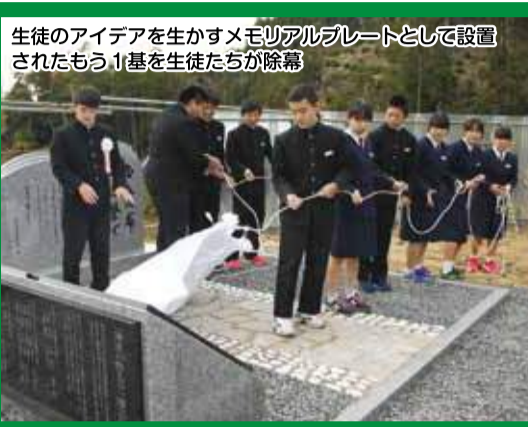
生徒のアイデアを生かすメモリアルプレートとして設置されたもう1基を生徒たちが除幕