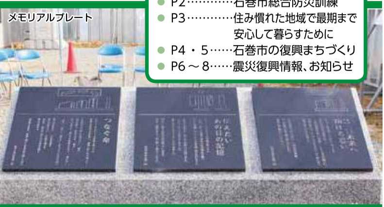
メモリアルプレート