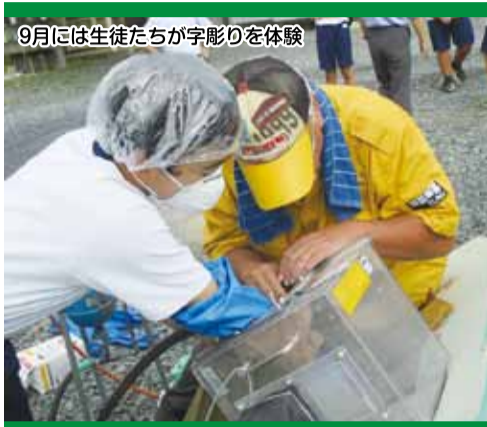
9月には生徒たちが字彫りを体験