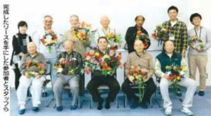
完成したリースを手にした参加者とスタッフら