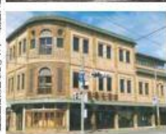
昭和5年5月5日付の河北新報に掲載された「石巻物産陳列場開場」の記事の真裏(上)と現在の市指定文化財「旧観慶丸商店」