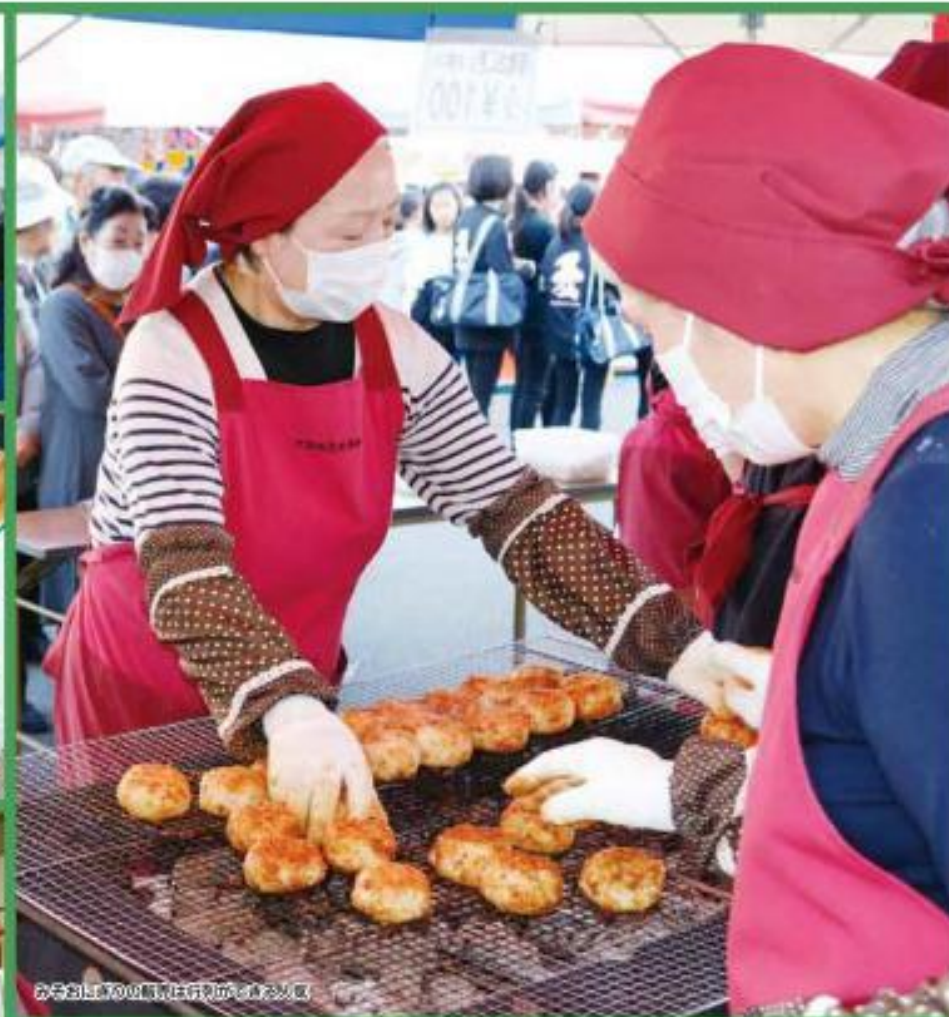
お好み焼きの調理は行方不明の女性