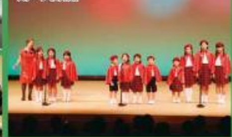
ステージでの合演