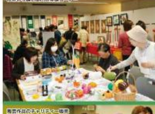
陶芸作品のチャリティー販売