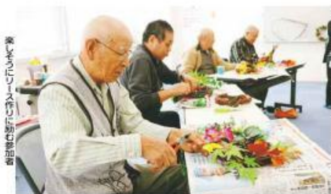
楽しそうにリース作りに取り組む参加者

きれいなクリスマスリース作りらしい。むしろ高齢の男性たちも意外な活躍ですが、軽口も飛び出し楽しい雰囲気で。社団地域包括支援センターの介護予防教室の一環で月1回、社団保健福祉センター清徳館で開いているおしかメンスカフェの10月の活動です。 名称の通り、高齢男性だけが参加できる活動です。「男だけで気軽に集まれる場があれば」という声を受けて、平成24年度にスタートしました。旧社団地区を対象とし、本年度は毎月、60~80代の十数人が参加しています。 年度当初にこんな活動をしたのかを話し合い、年間事業を決めます。本年度は転倒予防の講話と調理実習、コミュニケーションマシーン、サン・ファン館見学、ノルディックウォーキング、クリスマス会・忘年会、書き初め、恵方巻き