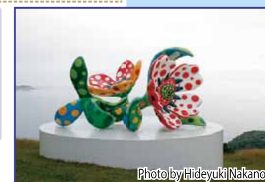
『真夜中に咲く花』 Artist: 草間彌生

牡鹿半島先端・鮎川エリアでは、カラフルなドットと海とのコントラストが印象的な「真夜中に咲く花」をはじめとしたアート作品が展示されました。