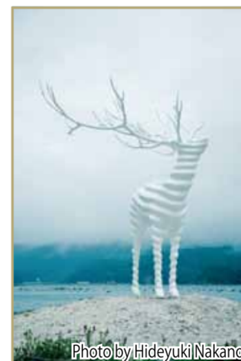
『White Deer(Oshika)』 Artist: 名和晃平

牡鹿半島中部エリアでは、貝殻の入江に「White Deer(Oshika)」がある荻浜・桃浦エリアでアート作品が展示されました。