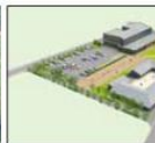
▲総合支所周辺整備イメージ