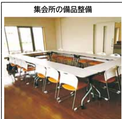
集会所の備品整備

市の復興のため、国内外より寄附金をいただいています。平成28年度までに、総額13億円以上の寄附があり、復興に必要な事業に役立てられています。 平成28年度までの総額：2,734件 1,355,098,034円 ＜活用事例＞