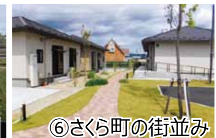
⑥ さくら町の街並み