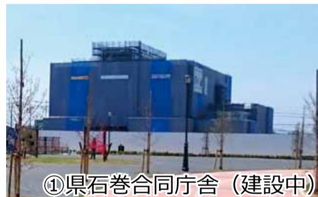
① 県石巻合同庁舎(建設中)