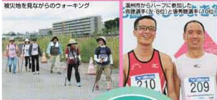
被災地を見ながらのウォーキング

んで石巻の味を楽しむ光景が見られました。初日にはウォーキングの部が復活。約120人がウォーキングとノルディックウォーキングで、石ノ森萬画館から東日本大震災で甚大な津波被害を受けた湊地区や門脇地区約8キロを巡りました。一帯では、石巻南浜津波復興祈念公園などの整備事業が進められていて、参加者は被害の大きさと復興のまちづくりに関心を示していました。