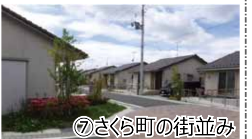
⑦ さくら町の街並み