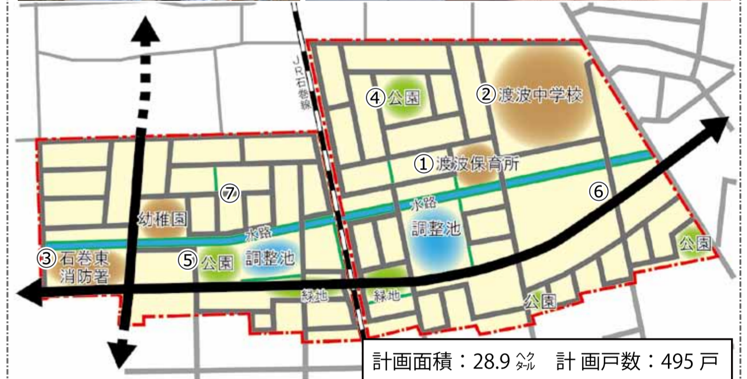
計画面積：28.9 畝 計画戸数：495 戸