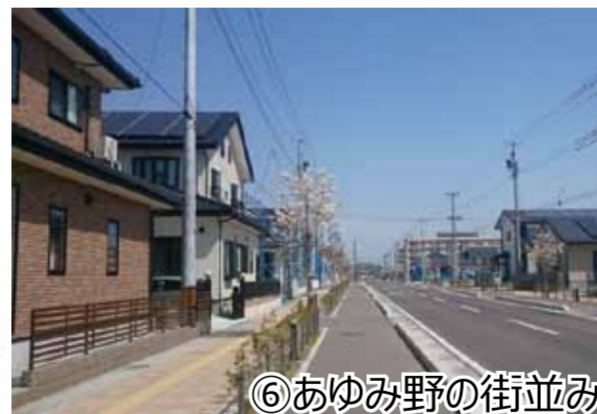
⑥ あゆみ野の街並み