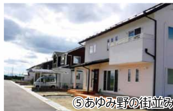
⑤ あゆみ野の街並み