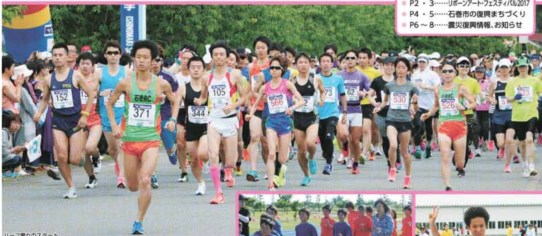
ハーフ男女のスタート