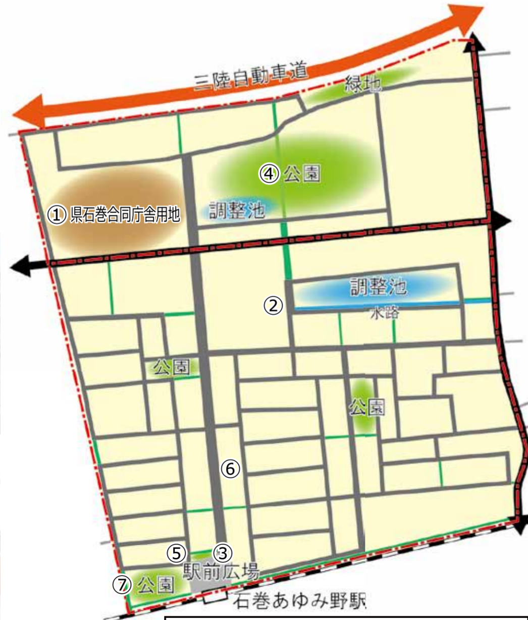
計画面積：41.1 畝 計画戸数：744 戸