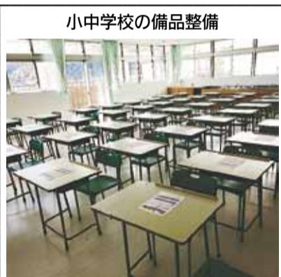
小中学校の備品整備