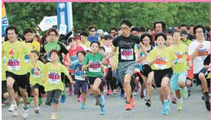
子どもたちも元気にスタート(2キロ・3キロの各種目)