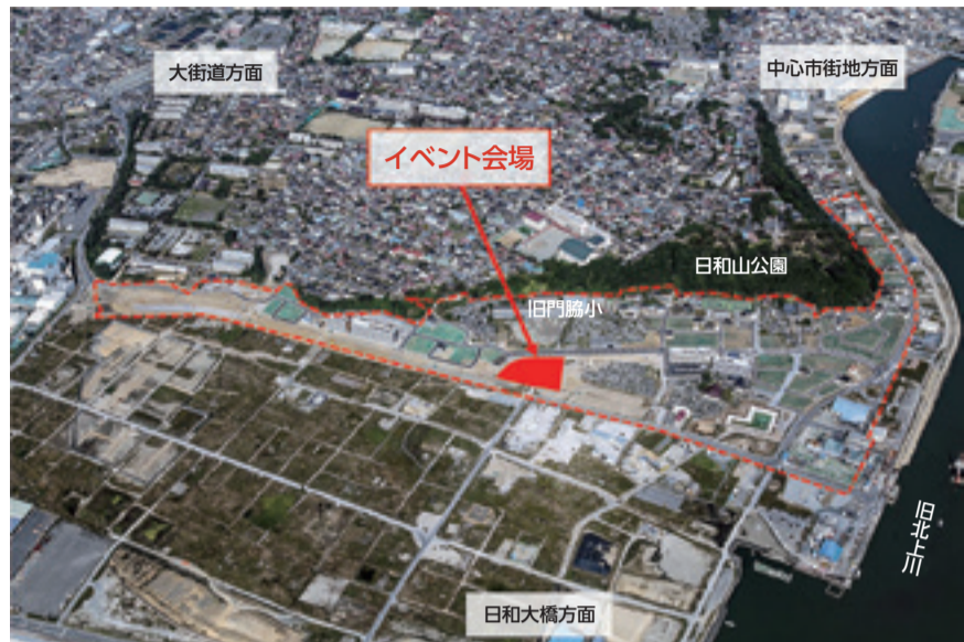
▲イベント会場位置図

内容 日高見太鼓、渡波獅子風流等楽しいステージとおいしいグルメが勢ぞろい!石巻物産市も開催します。