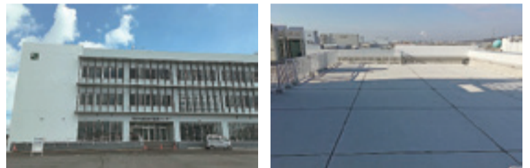
▲市水産総合振興センター

新たに次の施設を石巻市津波避難ビルとして認定しましたのでお知らせします。 石巻市津波避難ビル第32号 市水産総合振興センター(魚町二丁目12-3)