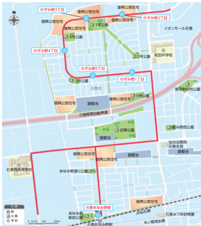
バス運行経路および新設バス停位置図

問 市地域振興課(内線4243) (株)ミヤコーバス石巻営業所 ☎22-4161