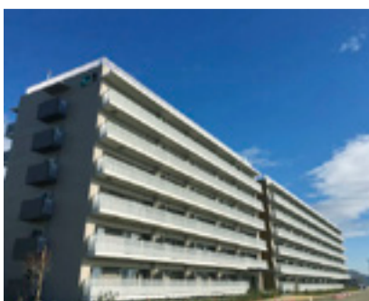
▲市営門脇西復興住宅