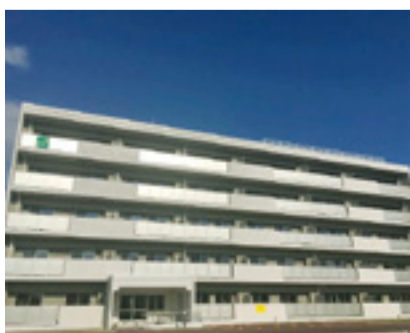
▲市営新館復興住宅