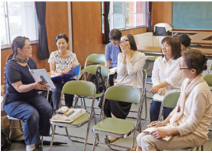
▲例会では会員同士がアドバイスを送り合います

今では読み聞かせの授業を心待ちにしている児童も多く、豊原代表は「立ち上げた先輩方が子どもたちのために小学校とともに取り組んできたおかげです」と