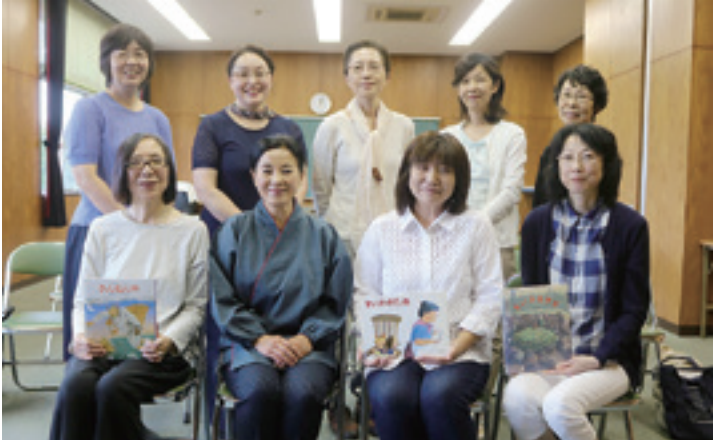
▲石巻絵本とおはなしの会のみなさん