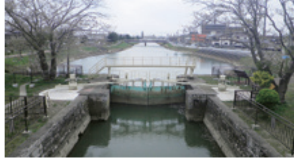
▲北上運河と石井閘門

石巻市水押から東松島市鳴瀬川河口までの総延長13.9kmの北上運河のうち、定川(釜閘門)までの5.9kmを北上運河といひ、今春、新たに宮城県遺跡台帳に登録されました(東松島市では釜閘門から野蒜築港跡まで、すでに遺跡登録済み)。