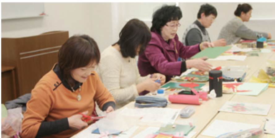
▲心に響く作品を生み出す会員の皆さん

◆投稿募集 皆さんからの投稿をお待ちしています。テーマに沿ったあなたのお話をお寄せください。 テーマ 「ありがとう」 日常生活の中で、皆さんの「ありがとう」に関する逸話(エピソード)をお聞かせください。 字数 400字以内 投稿方法 住所、氏名、年齢、電話番号を明記し郵送またはEメールで秘書広報課あて