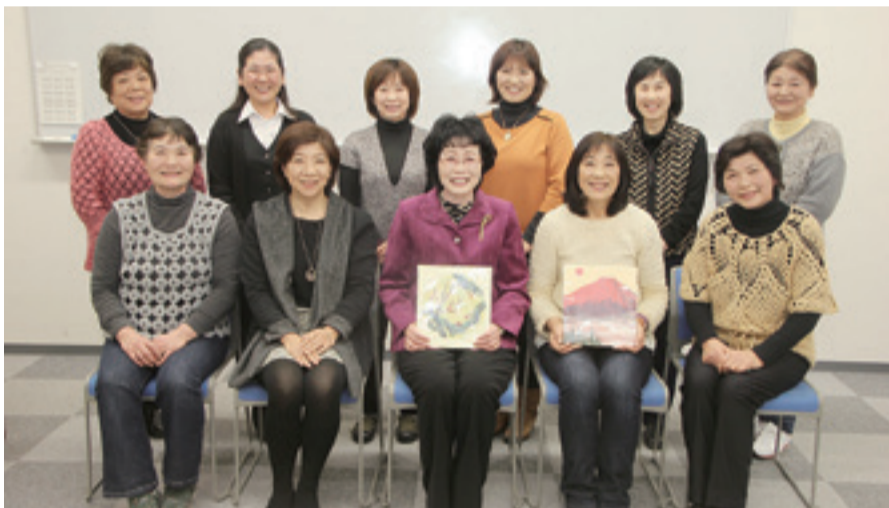
▲「和紙が好き、ちぎり絵が好き、仲間が好き」が合言葉です