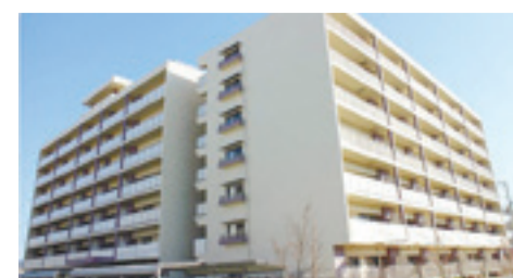
市営駅前北通り復興住宅