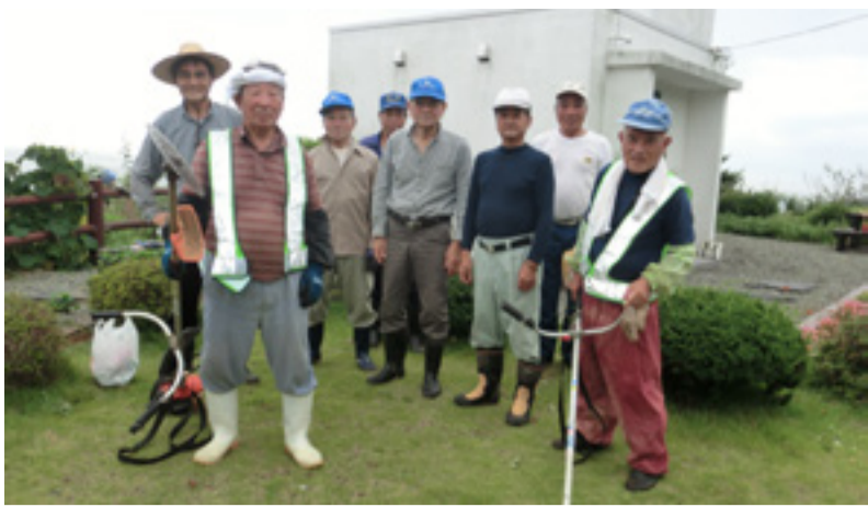
▲大須灯台会のメンバーの皆さん

海上には、視界の全てを奪う濃霧や突然の嵐等、常に危険が横たわっています。そのような場所で働く漁業者を安全な港に導く灯台は市内に数多くあります。雄勝町大須の大須崎灯台も昭和24年から66年間にわたり航行する船舶を見守ってきました。