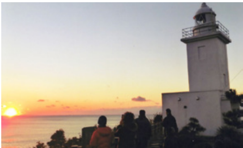
▲美しい景色が魅力の大須崎灯台には多くの人たちが訪れます

大須崎灯台に感謝の気持ちを抱き、ボランティアで清掃活動を行っているのが、地元の漁業者OBを中心構成する「大須灯台会」です。正会員と協