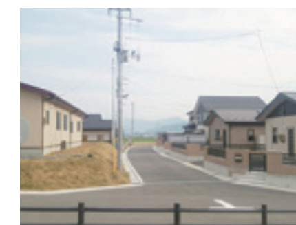
〈北上地域〉釜谷崎地区