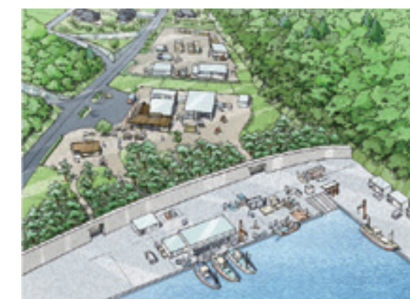
被災低平地の復興イメージ図

被災した低平地は、産業の場として再建可能な環境を創出するために漁港や基盤の整備を行っています。