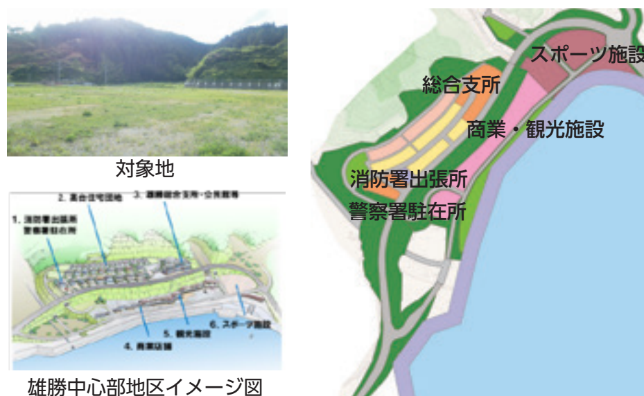
雄勝中心部地区イメージ図

かつて雄勝地域の中心部であった伊勢畑に、住宅地、総合支所等公共施設、商業施設、観光施設、運動施設が一体となったまちの中心を再生します。