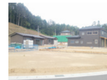
〈雄勝地域〉大浜地区

災害が発生した低平地の区域を、高台や内陸部へ集団で移転するために住宅団地を整備しています。また、移転元地は、産業等の場として再生することを検討しています。