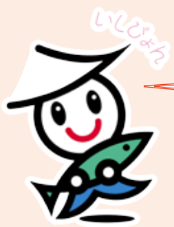
石巻市イメージキャラクター