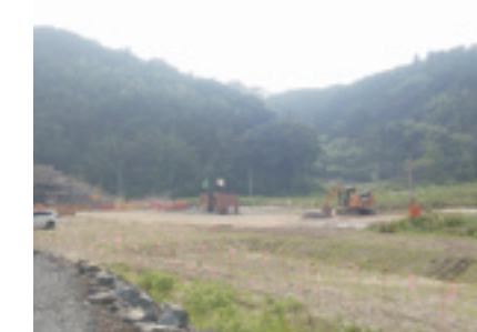
〈北上地域〉白浜地区

被災した低平地は、産業の場として再建可能な環境を創出するために漁港や基盤の整備を行っています。