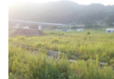
〈雄勝地域〉水浜地区