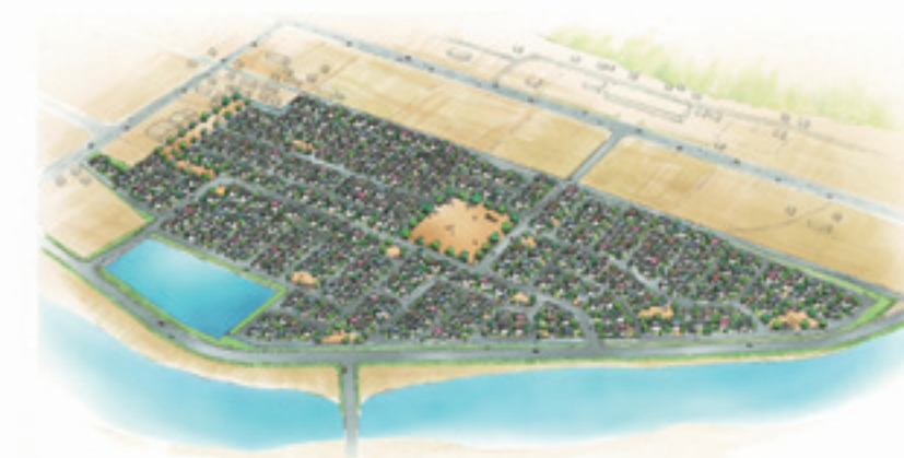
河北地区イメージ図