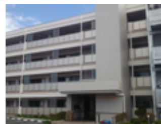
三ツ股第一復興住宅