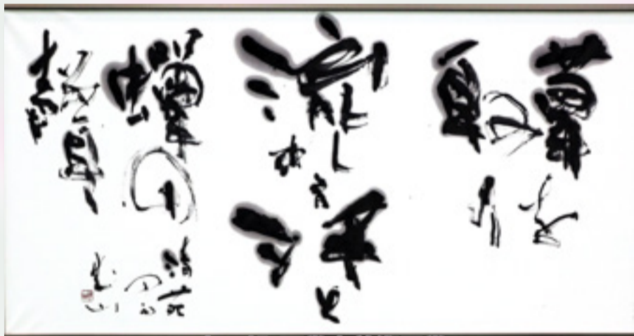
書の部・石巻市美術展賞