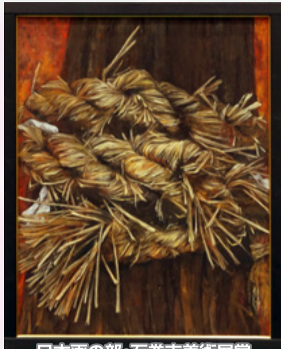
日本画の部・石巻市美術展賞