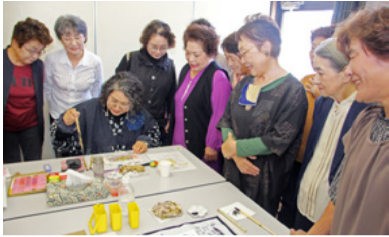
▲和気あいあいとした雰囲気活動に励むメンバーの皆さん

ば、すべてすばらしい作品になります」と話します。そんな皆さんの合言葉は「下手でいい、下手がいい」だそうです。