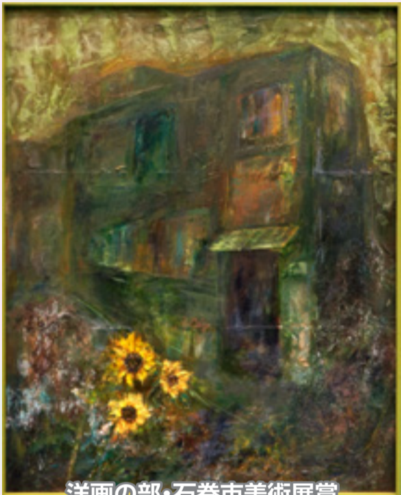
洋画の部・石巻市美術展賞