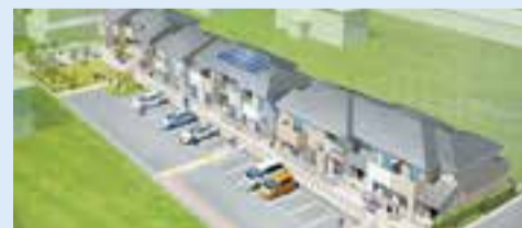
▲黄金浜南復興公営住宅イメージ