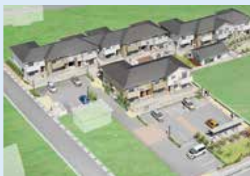
▲浜松町復興公営住宅イメージ