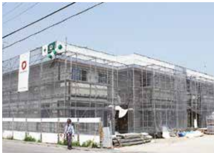
▲全体の進捗率は約45%です。