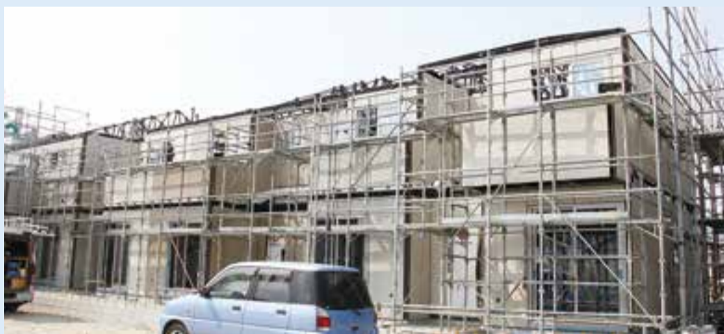
▲全体の進捗率は約30%です。

参加者は、近所になる世帯ごとのグループに分かれ、出身地や現在の住まいのこと等を和やかに談笑していました。