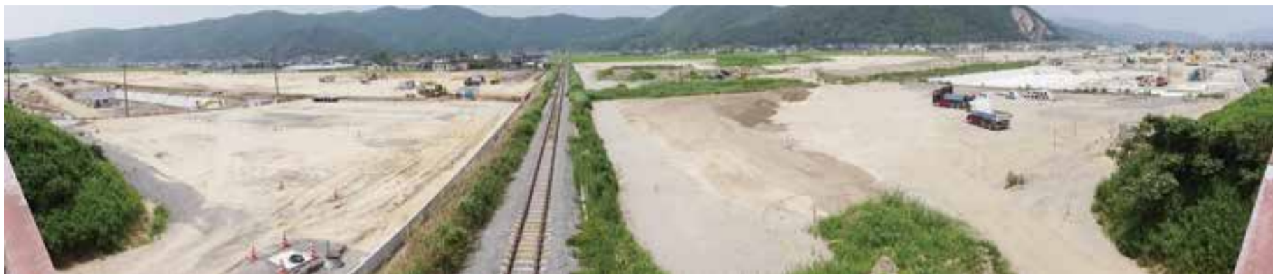
新渡波・新渡波西地区被災市街地復興土地区画整理事業