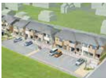
▲栄田復興公営住宅イメージ