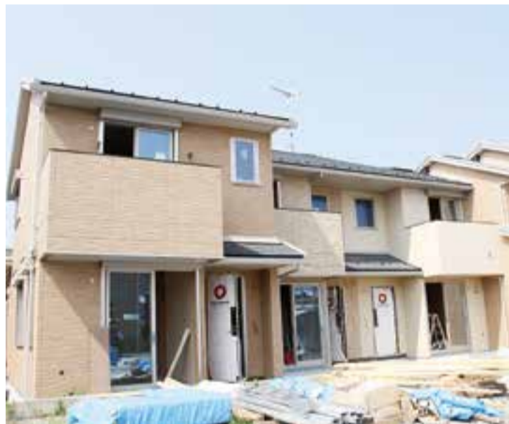
▲全体の進捗率は約60%です。