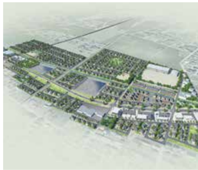
新渡波・新渡波西地区 イメージ