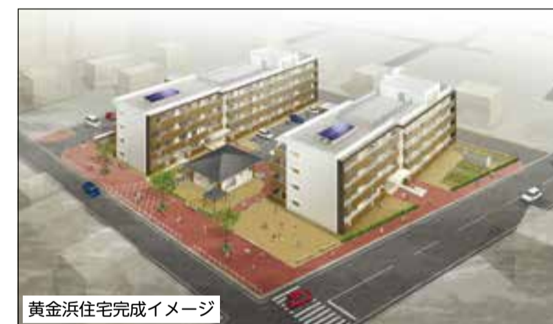
黄金浜住宅完成イメージ