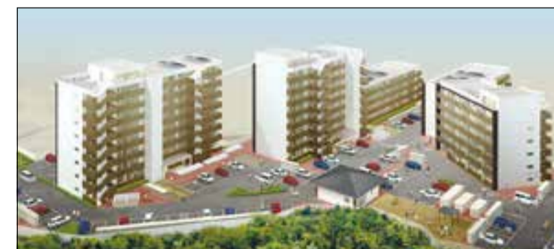
吉野町一丁目住宅完成イメージ