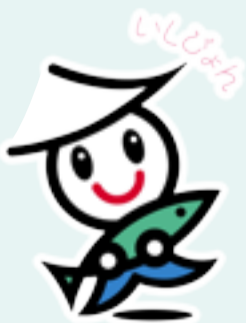
石巻市イメージキャラクター