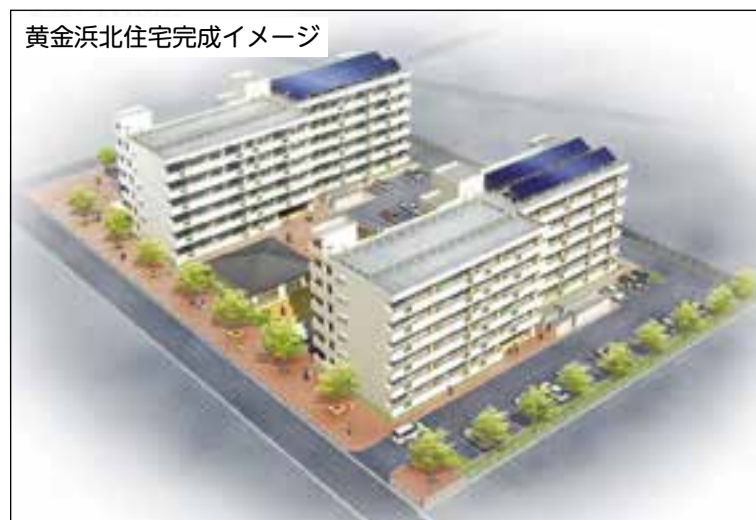
黄金浜北住宅完成イメージ