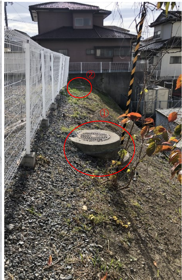
撮影⑨存置マンホール