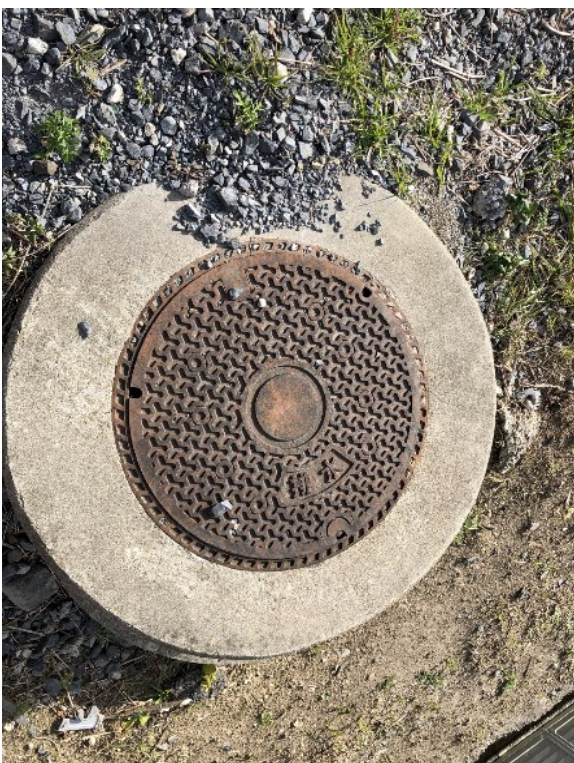
撮影⑩存置マンホール①