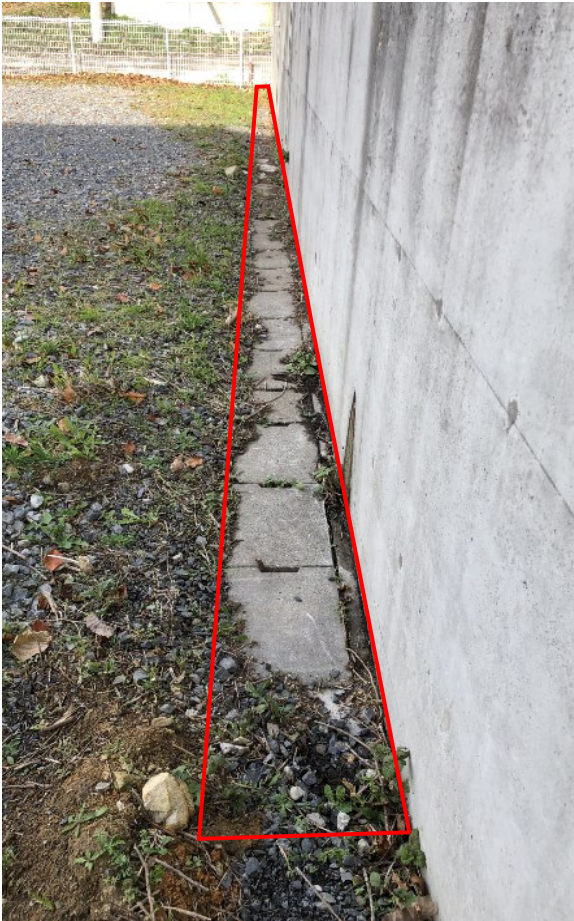
撮影⑧既存宅内側溝