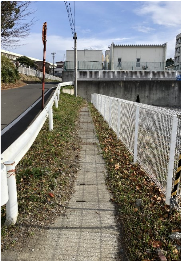
撮影④北側市道接面（東側）